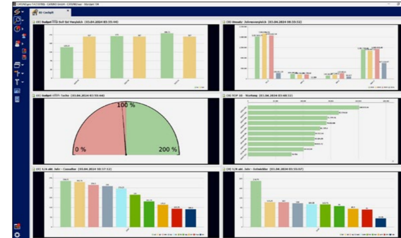
CATUNO.pro BI-COCKPIT @ CATUNO

Ein Projektleiter sagte einmal: „CATUNO denkt nicht in Modulen, sondern in Prozessen. Ihr habt uns nicht ein System verkauft, sondern unsere Arbeit verstanden.“ – Das zeigt: Auch wenn unsere Software modular auf-